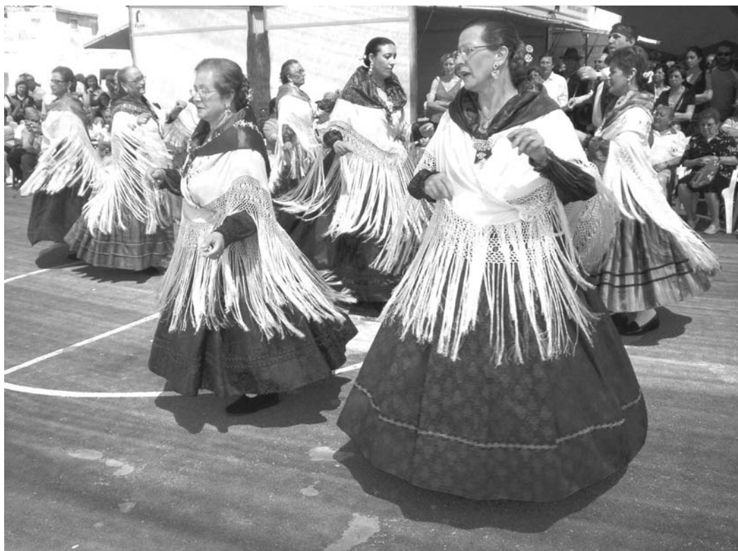
Grupo de jotas de Villar actuando en Serraltur, feria gastronómica, turística y comercial de La Serranía.

Pero para que de sitios mas o menos lejanos vengan a “descubrirnos”, a disfrutar de nuestros paisajes, para utilizar el turismo y los productos comarcales, que era otro de los reclamos de la propaganda de mano de la feria, tendrán los responsables que hacer cursillos acelerados de amor por los pueblos de La Serranía y su medio natural, que está peor cada día.