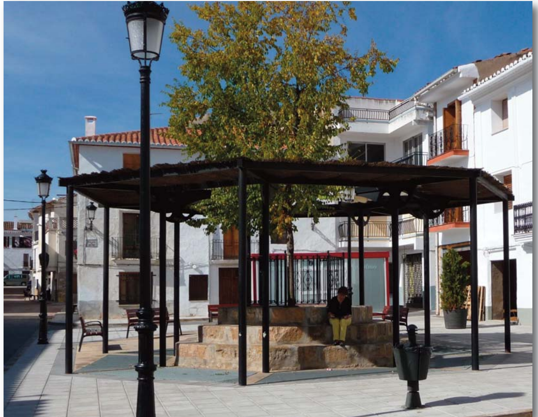
Plaza de Aras de los Olmos

controlar a los agentes especulativos y por ello ha de saber resolver los problemas que se planteen entre las responsabilidades locales y las autonómicas.